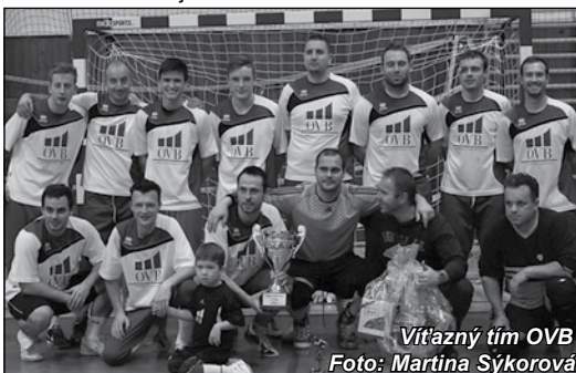
Víťazný tím OVB

Avšak víťazmi turnaja boli všetci, ktorí prišli a svojim dielom prispeli k jeho dobrej úrovni. Svojimi výkonmi, férovou a slušnou hrou dobre reprezentovali svoju spoločnosť a propagovali futsal v Novom Meste nad Váhom. Organizátori ďakujú všetkým za spoluprácu a tešia sa na ďalší, v poradí už 4. ročník Turnaja firiem vo futsale 2015. Ďakujeme za rozhovor.