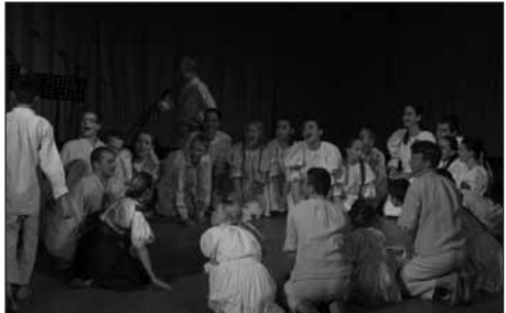
Z galaprogramu titulom Kvalitný produkt Podjavoriny oceneného FS OTAVA , foto Mgr. J. Šišovský

drak vetroplach, s ktorou sa zúčastnilo aj Festivalu v Kysáci, súbor odohral 32 bábkových predstavení v meste a okolí. Poetická scéna DG našťudovala 2 pásma: Padali hviezdy, padali... – 3-x (z toho 1-x v DK Bratislava N. Mesto) a A víno sa poéziou snúbi... ( 3-x s priemernou účasťou cca 80 ľudí). Odrežovala pásmo Poézia môjho srdca . Bolo 15 kurzov jogy (131), kurz klavíra (14 frekventantov) a 6 kurzov cvičenia pre ženy (117). Pri MsKS pôsobilo 5 klubov. Odd. sa podieľalo na organizovaní ďalších podujatí.