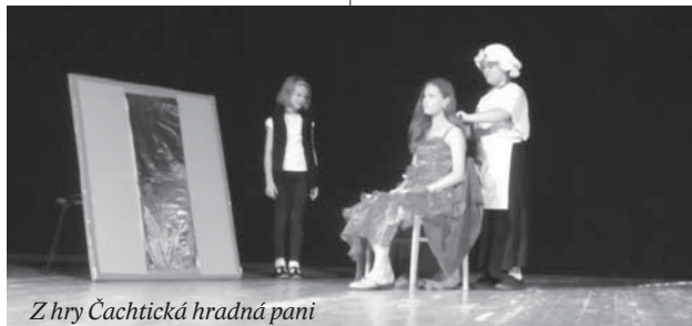
Z hry Čachtická hradná pani