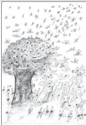
1. miesto NO 2005 Koloman LEŠŠO