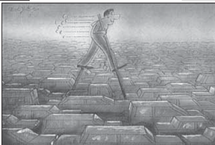
1. miesto NO 2007 - Jozef OLŠAVSKÝ