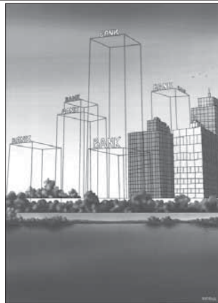
1. miesto NO 2009 Lubomír KOTRHA

Ako pozvánku na ňu prinášame niekoľko reprodukcií víťazných prác z predchádzajúcich ročníkov.