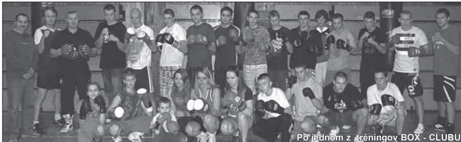
Po jednom z tréningov BOX - CLUBU