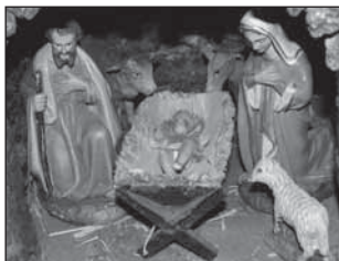
dva betlehemy, ktoré sa tradične tešia veľkému

S posolstvom Vianoc k svojim návštevníkom prichádza Podjavorinské múzeum. Zhruba od polovice decembra sprístupní