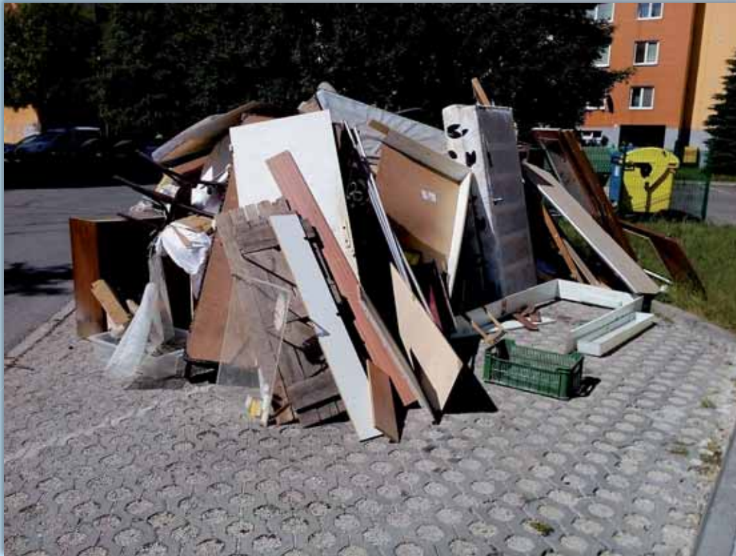
Foto je z vývozu objemného odpadu v zmysle VZN mesta = organizovaný jarný zber objemného odpadu na Športovej ulici