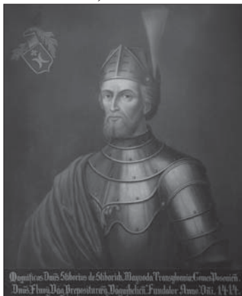
Fiktívny portrét Stibora: Monografia I.