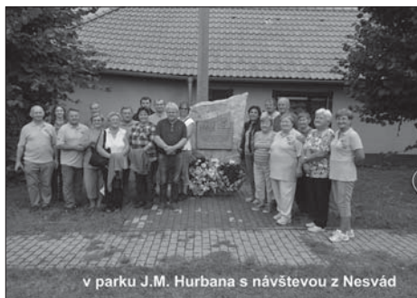
v parku J.M. Hurbana s návštevou z Nesvád

skom kraji i tohtoročnou novou tabuľou Prosbá lesa od autora kríža.