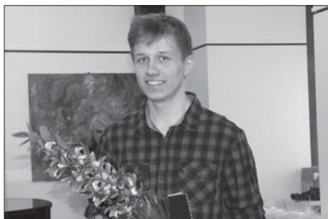
Cenu za pozoruhodný mužský herecký výkon získal