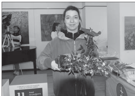
Cenu za hereckú kolektívnu súhru si odnieslo Ochotnícke divadlo KC Kysáč