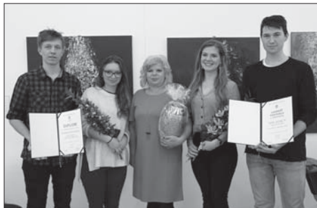
Hlavnú cenu, titul Laureát Festivalu Aničky Jurkovičovej si odniesol Neprofesionálny divadelný súbor Atak 9 Dovalovo

Záhorácke divadlo, Senica s hrou Wiliama Shakespeara: Svatojánske drimoty