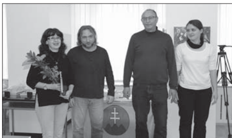
Cenu diváka získalo Divadlo 21 z Opatovej