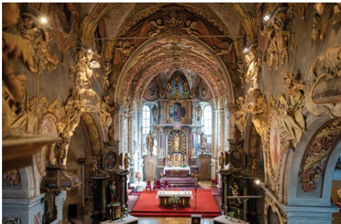
Interiér kostola Narodenia Panny Márie s barokovým oltárom, ktorý dal vyhotoviť prepošť Jakub Haško.

Vnútro kostola ohromí najmä bohatstvom štukovej výzdoby, ktorú dopĺňajú maliarske diela. Vo výzdobe prevažuje vegetabilná (rastlinná) ornamentika. V maliarskej zložke na severnej stene upútajú nástenné malby s námetmi Nanebovstúpenia Pána a Nanebovzatia Panny Márie.