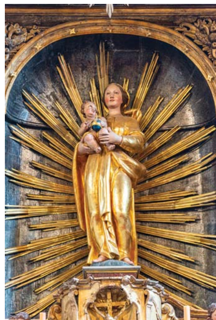
Baroková socha Madony z obdobia významnej Haškovej obnovy kostola.