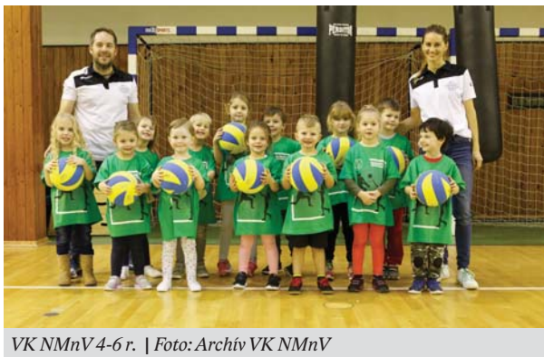
VK NMnV 4-6 r.