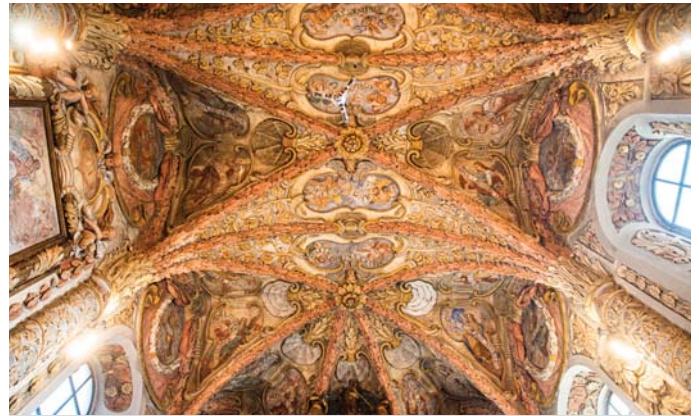
Bohatá výzdoba klenby presbytéria.