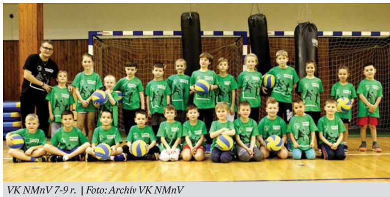
VK NMnV 7-9 r.