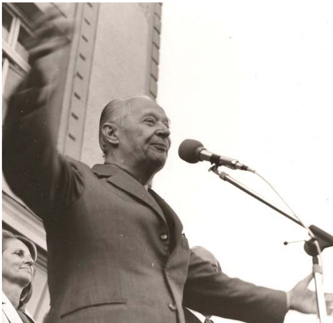
Alexander Dubček na predvolebnom mítingu VPN na novomestskom námestí dňa 1. júna 1990.