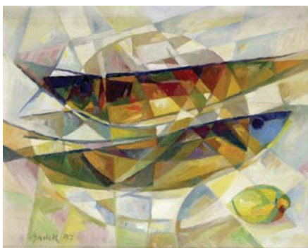
ZÁTIŠIE, olej, 1997

fiky u profesora Vincenta Hložníka. V rokoch 1957 - 1971 pedagogicky pôsobil pri závodnom klube Niklova huta v Seredi. V roku 1964 sa presťahoval do Trnavy, kde vytvoril množstvo architektonických realizácií.