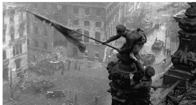
30.4.1945 vojaci Červenej armády vztýčili nad budovou Ríšskeho snemu v Berlíne zástavu víťazstva. Nemecké vojská nachádzajúce sa v Berlíne kapitulovali 2.5.1945.