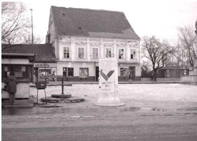
Časť námestia v Novom Meste nad Váhom pred tridsiatimi rokmi