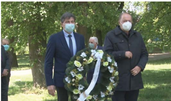
Pri príležitosti víťazstva nad fašizmom položili zástupcovia Nového Mesta nad Váhom k pamätníku v parku J. M. Hurbana veniec spolu so zástupcami SZPB. Pripomínanie si tohto významného dňa pre celé ľudstvo má dva základné významy: poďakovanie všetkým, ktorí sa obetovali a položili svoje životy za oslobodenie od fašizmu, a zároveň ide o dôležité memento, aby sme každú malú iskru prejavy fašizmu a rasovej neznášanlivosti uhasili ihneď pri jej zrode.