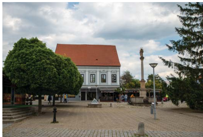
Časť novomestského námestia v súčasnosti.

VPN a tiež aj jediný predseda tejto občianskej iniciatívy.