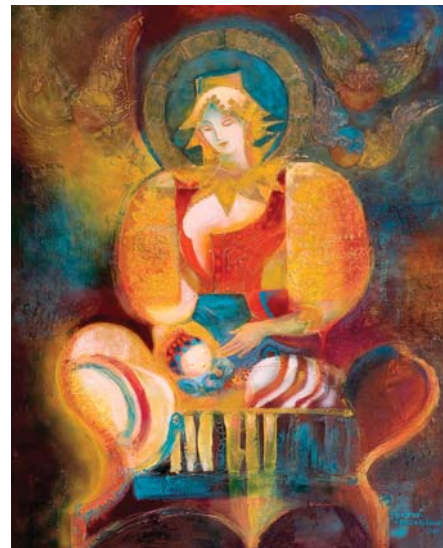
MATKINO ŠTASTIE, akryl, 2009