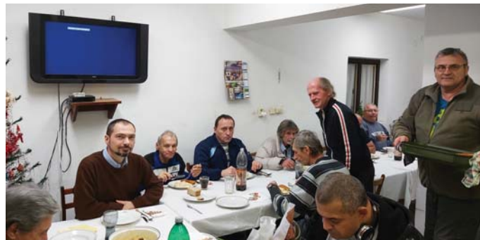
Klienti Útulku tiež túžia po spoločnosti a teple domova.

a oplátky. Niektoré ochotné ženy nám pravidelne napečú a prinesú koláče a zákusky, takže vďaka Bohu nemáme nedostatok. Každý rok si sadá vedúci zariadenia s klientmi k štedrovečernému stolu potom, čo v krátkom príhovore zhodnotil a v modlitbe poďakoval za všetko, čo uplynulý rok priniesol. Následne sa rozdáajú darčeky a zvyšok večera trávi každý podľa vlastného uváženia buď na spoločenskej miestnosti alebo v súkromí na izbe. Na tomto mieste sa patrí poďakovať každému, kto v tomto zložitom čase zabúda na svoje starosti a myslí na tých najposlednejších, ktorí nemajú často krátko vôbec nikoho. Nesúdme, lebo nikto z nás nevie, či sa jedného dňa nemôže ocitnúť on sám, či niekto jemu blízky na ich mieste, bez prostriedkov, bez pomoci, bez prístrešia.