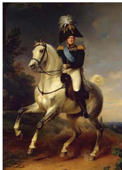
Ruský cár Alexander I.

Mohr, a Lipský veliteľom jazdeckého oddielu – eskadróny, pozostávajúcej zo sto mužov.