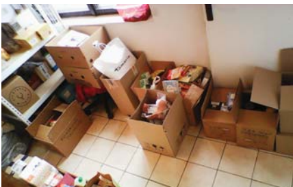
Každý dar sa počíta.

Možno Vás mnohých prekvapí konštatovanie že Vianoce pre klientov Útulku ako aj ľudí bez domova všeobecne nie sú rovnako radostným časom ako pre väčšinu bežných ľudí. Na vysvetlenie treba povedať, že pre ľudí bez domova (a to rovnako pre tých na ulici či umiestnených v zariadení) sú vianočné sviatky časom emocionálneho vypätia, skúšky, ktorú žiaľ niektorí ani nezvládnu. Každý rok sa pravidelne niekto „stratí“, to znamená že u neho dôjde k recidíve nejakej závislosti, najčastejšie alkoholovej a zhoršeniu psychických problémov. Dotyčný človek jednoducho svoj pocit smútku a osamelosti, vybičovanej v tomto citlivom čase, ide takýmto spôsobom riešiť neznámo kam. Niektorých šťastlivcov na pár dní prichýlia príbuzní, či známi, ale drvivá väčšina trávi vianočné sviatky v Útulku. Samozrejme, že zo strany zamestnancov aj väčšej časti klientov je snaha pripraviť sa na prežitie Vianoc v čo najlepšej pohode, pokoji a dostatku. Už od októbra postupne zbierame od rôznych ochotných osôb, spoločností či organizácií dary a príspevky pre našich klientov vo forme trvanlivých potravín, drogérie či finančných prostriedkov, ktoré sa snažíme na Štedrý večer rovnomerne rozdeliť do balíčkov. Na štedrý deň (ale aj počas ďalších dní) máme prestretý spoločný stôl a stromček. Štedrovečerné menu sa snažíme pripravovať vo vlastnej réžii, so zapojením klientov a zamestnancov do spoločného varenia. Suroviny sčasti dostaneme, sčasti ich kupujeme. Menu je klasické, nechýba aj med