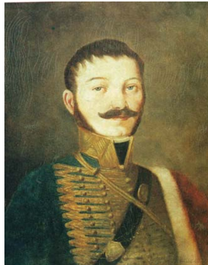
Významný európsky kartograf, husársky dôstojník Ján Lipský.