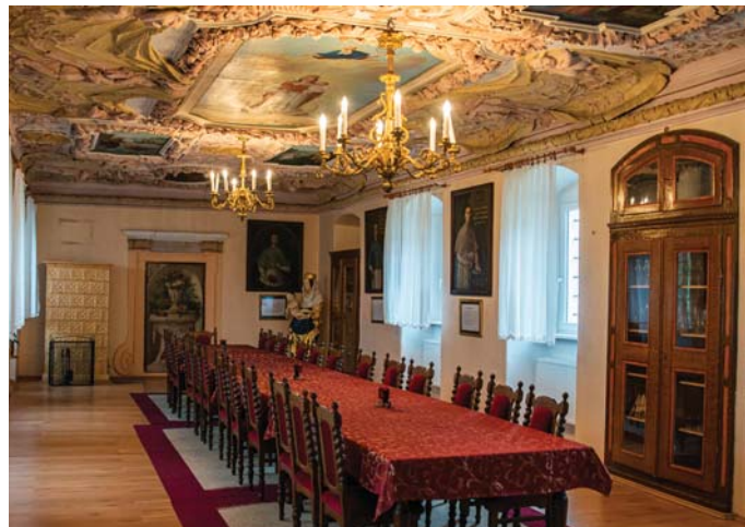
Refektár novomestskej prepozitúry, kde 7. decembra 1805 obedoval cár Alexander I.