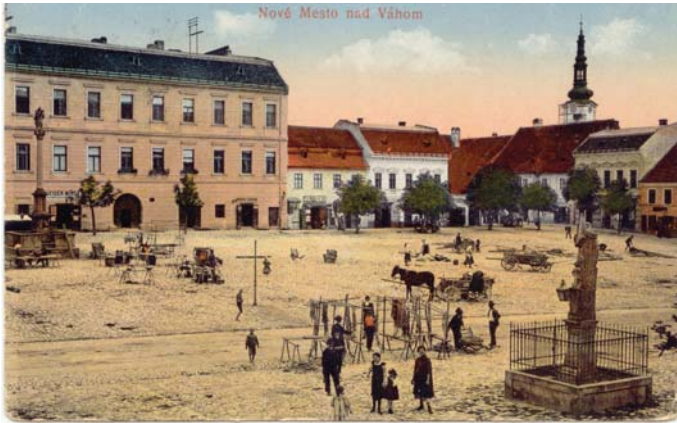
Bergerovec, dominanta námestia, okolo r. 1918