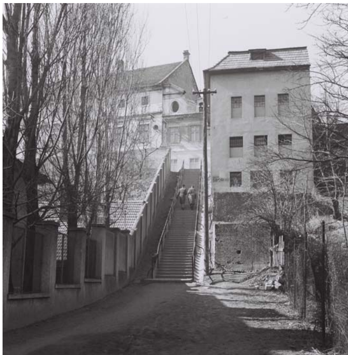
Schody vedúce z Inoveckej ulice na Ul. Júliusa Gábriša. Vzácný záber na časť Bergerovca (vľavo hore), v ktorej sa nachádzala šľachtická rezidencia Věčeovcov.