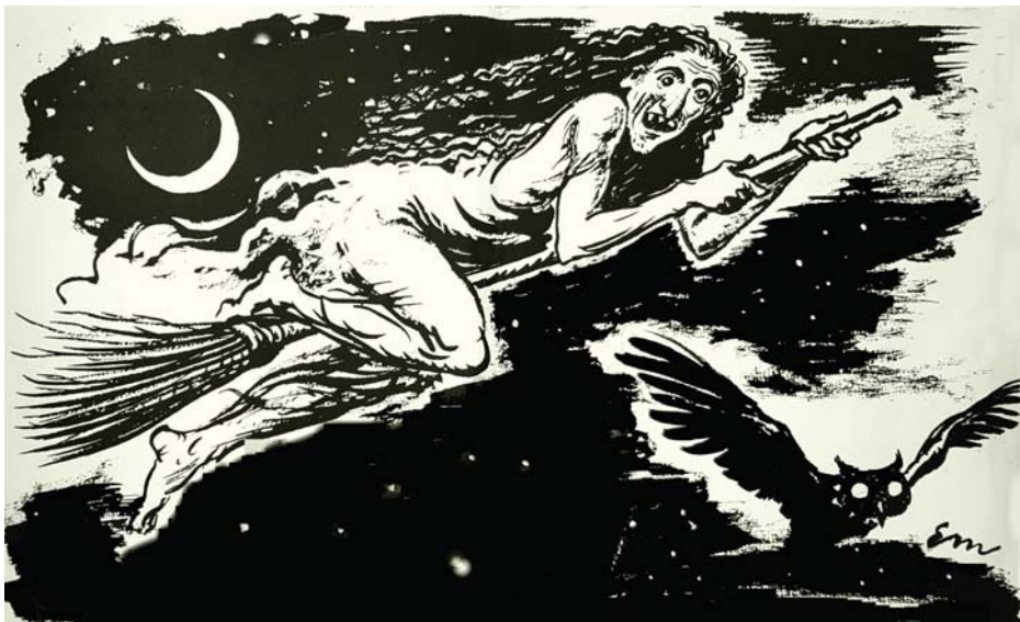
Ilustrácia Edmunda Massányiho k článku O pálení bosoriek v knihe Jozefa Braneckého Z tisícročia – povesti a historické články z r.1943

odňať mlieko kravám i ovciam a privolať na ľudí choroby.