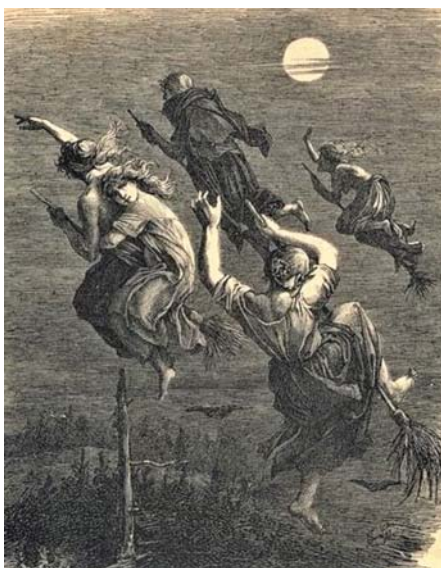
Bosorky letia na stretnutie s diablom