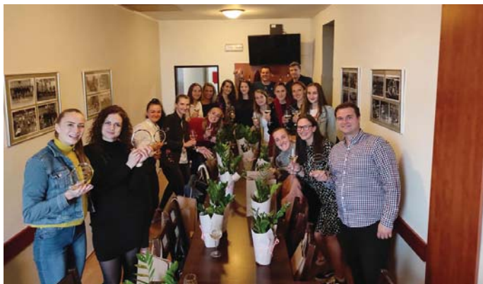
Zaslúžený pripitok po skončení úspešnej sezóny

Volejbalistky VK Nové Mesto nad Váhom majú za sebou mimoriadne úspešnú sezónu. Nielenže sa stali finalistkami Slovenského pohára, ale aj v Extralige bojovali o medaily. Napokon ich z bojov o vzácne kovy stiahla nešťastná pandémia, s ktorou bojuje celý svet. Napriek tomu je konečné štvrté úžasným úspechom.