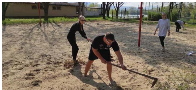
Klub si už chystá kurty na letné zápasy na piesku na Zelenej vode.

Keďže všetky súťaže museli byť ukončené do 18. 4. , kvôli ďalším reprezentačným povinnostiam iných hráčok, klubu nezostávalo nič iné, ako odrieknuť účasť v ďalšom zápase a predčasne tak ukončiť boje o bronzové medaily, ktoré tak získali Nitranky.