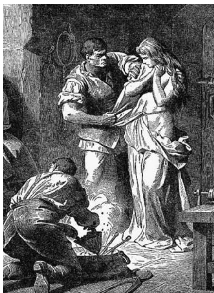
Hľadanie diablovho znaku – stigmy, na tele bosorky počas vyšetrovania