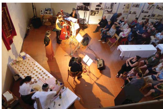
Hudba na tanieri | Foto archív Šamajim Třebíč

Covidové leto prineslo viac kultúry ako v uplynulých rokoch