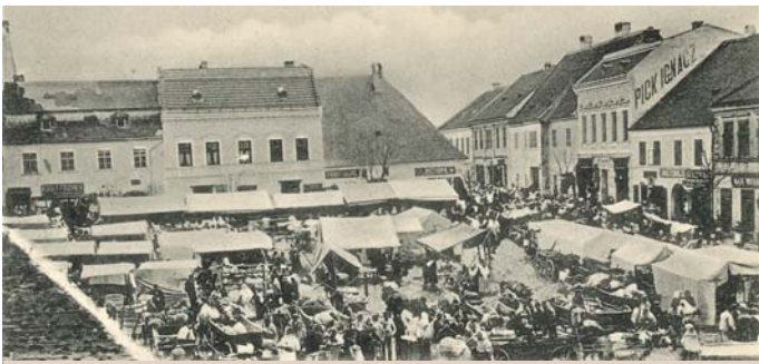
Pohľad na juhovýchodnú stranu námestia počas konania jarmoku. Dobová pohľadnica z konca 19. st.

Meste nad Váhom. V ďalšom texte listiny Maximilián rozširuje Mestu jarmočné právo, a to na sviatok Premenenia Pána (6. augusta) a ďalší sa mal konať v nedeľu pred sviatkom sv. Tomáša apoštola (21. decembra). Všetkých účastníkov novomestských jarmokov zbral panovník pod svoju osobitnú ochranu. Ďalšie, posledné rozšírenie jarmočného práva vydal kráľ Ferdinand III. keď v roku 1637 potvrdil trhové privilégium Maximiliána, pričom rozšíril počet jarmokov o jeden, ustanovený na druhý deň po sviatku sv. Trojice. V októbri roku 1815 dovtedajšie trhové privilégia potvrdil aj František I. Podľa trhového práva mohlo Nové Mesto nad Váhom uskutočňovať počas roka až sedem jarmokov.