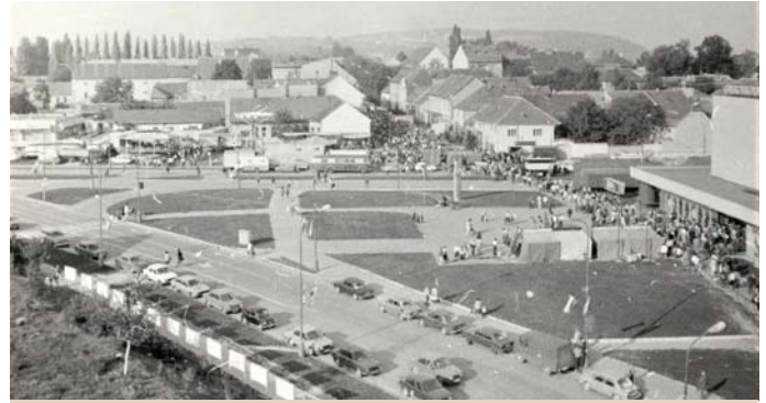
Hviezdoslavova ulica počas jarmoku 27. – 28.9. 1986.

Hlavným centrom výročných trhov bolo vždy námestie. Dobové pohľadnice jarmočného námestia nám odhaľujú čaro novomestských jarmokov. Všade sú ľudia - kupujúci a predávajúci, priam počť čulú vravu medzi nimi, vedľa šiatrov stoja kone a vozy, z ktorých sa tiež predáva tovar. Samozrejme, pri organizovaní jarmokov sa nezabúdalo ani na samotných návštevníkov: hostince a početné kaviarne boli akoby zriadené len pre tento jarmočný deň. Z objektov na námestí bola najdôležitejšia tzv. Vážnica, dominantna jarmočného námestia. Najskôr skutočne slúžila na váženie, neskôr tu bol veľmi populárny hostinec. Hostincov bolo, samozrejme,