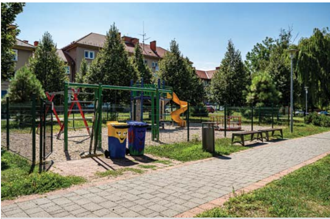
Detské ihrisko vo vnútrobloku Ul. 1, mája