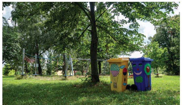
v parku D.Š. Zámotského

TSM: „Dobrý deň, koše pri detských ihriskách sú umiestnené...“