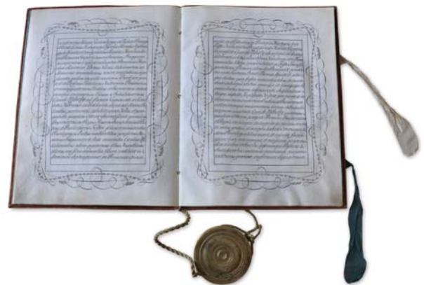
František I. listinou z roku 1815 potvrdil Novému Mestu nad Váhom dovtedajšie jarmočné privilégia. Originál v Štátnom archíve v Trenčíne.

Právom usporiadať jarmoky v minulosti nedisponovala každá sídelná lokalita. Muselo to byť hospodársky vyspelé mesto alebo mestočko, aby mu panovník udelil trhové privilégia. Takým Nové Mesto určite bolo už za panovania Žigmunda Luxemburského (1387 – 1437), pretože práve tento uhorský kráľ v roku 1435 okrem viacerých dôležitých výsad udelil nášmu mestu právo usporiadať výročné trhy. Podľa tohto práva „...sa Mestu umožňuje každoročne na sviatok sv. Prokopa (9. júla) a začiatkom veľkého pôstu (pohyblivý sviatok naviazaný na Veľkú noc, ktorý mohol pripadnúť na obdobie od polovice februára do polovice marca) a týždeň pred a týždeň po spomínaných sviatkoch odbavovať v meste výročné trhy (jarmoky) podľa zvyklostí, za akých sa konávajú v slobodných mestách. Okrem toho Novomešťania môžu užívať všetky práva, výsady a imunity v takom rozsahu, ako ich používajú a riadia sa nimi mešťania, hostia a obyvatelia mesta Trnava. Okrem toho žiaden obchodník nemôže v meste bez osobitného povolenia richtára a prisažných vyložiť na predaj ani strihať súkno a nastrihané predávať na lakte okrem domácich obyvateľov. Rovnako nikto nemá právo v spomínanom meste vyberať trhové poplatky ani na týždenných trhoch, ktoré sa tu zvyknú konať každý pondelok, ani na vyššie spomínaných jarmokoch na sv. Prokopa a na začiatku Veľkého pôstu.“