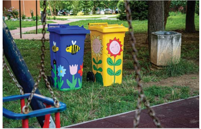
Detské ihrisko na sídlisku Hájovky

A ako hodnotíte farebné smetné nádoby na papier a plasty Vy? Najlepšie hodnotenie bude, ak budú plné odpadu a detské ihriská čisté.