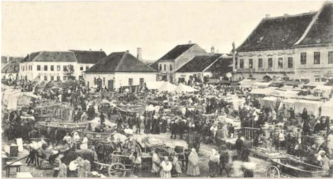
Novomestský jarmok na dobovej pohľadnici z konca 19. st.. Budova v prostriedku je Vážnica.