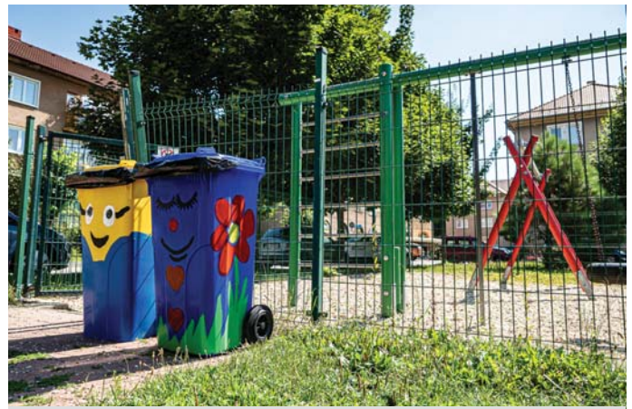
Detské ihrisko vo vnútrobloku Ul. 1, mája