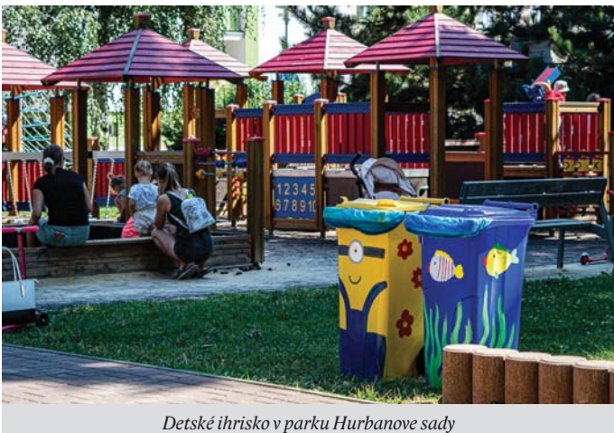
Detské ihrisko v parku Hurbanove sady

Novomešťanka: „Dobrý deň, viete prosím umiestniť na detské ihrisko za knižnicou nádobu na plasty, keďže sa tam hromadia plastové kelímky od čapovaných nápojov a nikoho už potom nezaujímajú?“