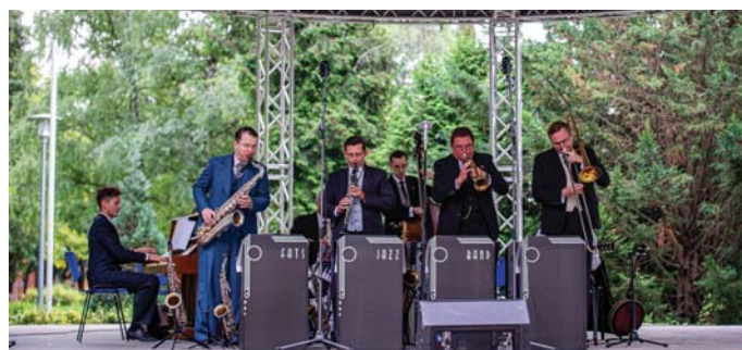
Fats Jazz Band