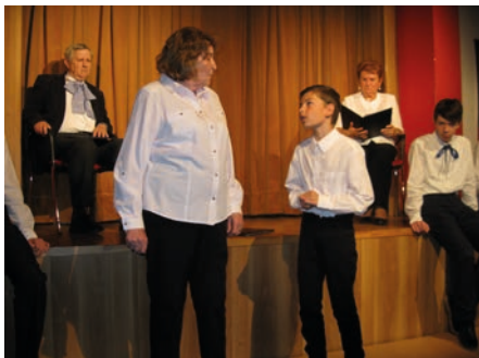
Básnik veľiký syn národa POH