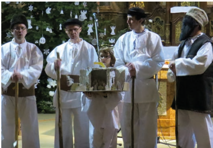
Členovia LH Rovnec pri predvádzaní betlehemskej hry. 6. 1. 2019