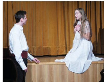
Shakespeareove slzy a smiech Romeo a Júlia

Poetická scéna DG ďakuje pracovníkom MsKs za poskytovanie priestorov a pomoc pri