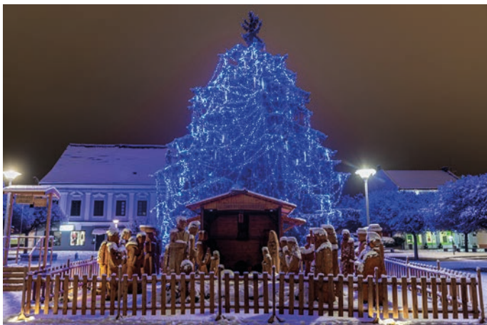
Na námestí žiari vianočný stromček i betlehem.

Námestie Slobody ožilo nielen vďaka tradičnému vianočnému stromčeku, betlehemu, adventnému vencu, ale i aleji malých vianočných stromčekov, okolo ktorých sa preháňajú soby ťahajúci sane. Nechýba ani osvetlenie a dekorácie na okolitých stromoch. Vianočný stromček sa stal jedným zo symbolov Vianoc. Obdobie počas štyroch adventných týždňov bez adventného venca si už snáď ani nevieme predstaviť. Zdobí naše domácnosti i námestia miest a obcí. Zdobí i Námestie Slobody. Každú adventnú sobotu sa na ňom postupne rozsviecovali biele sviečky.