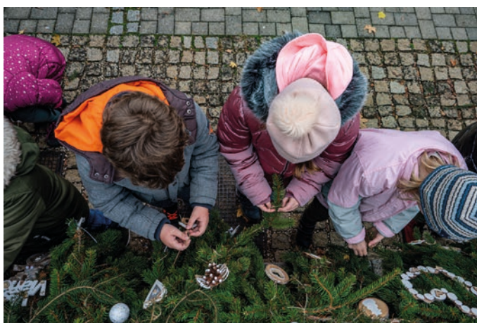
Deti novomestských ZŠ sa úlohy chopili s nadšením.