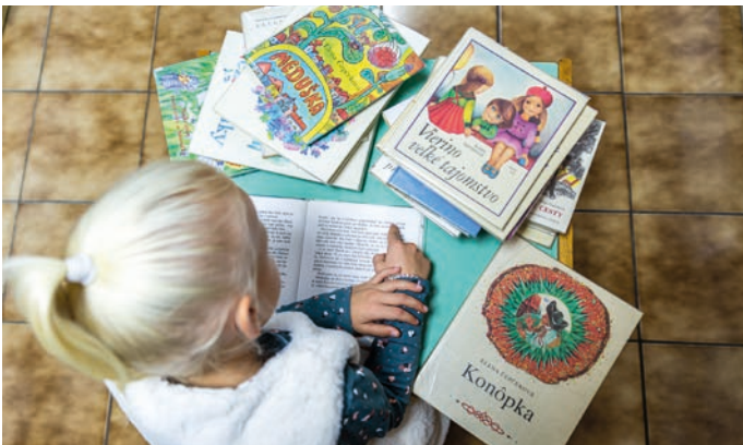
Fotografia k štvrtému kalendárovému týždňu upozorňuje na 100. výročie narodenia spisovateľky Eleny Čepčekovej.

Zima na námestí sa v kalendári končí tretím kalendárnym týždňom a vo štvrtom týždni ju vystrieda teplo novomestskej knižnice, kde je zobrazené dievčatko, ktoré má pred sebou knižky od spisovateľky Eleny