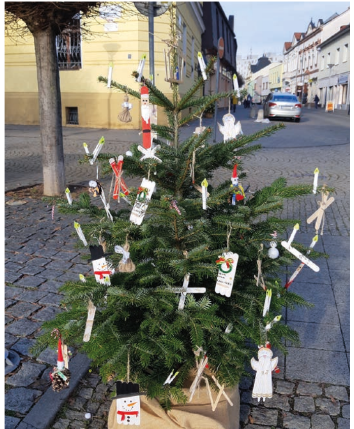
Vianočné ozdoby tvorili deti a vyzdobili stromčeky originálnymi ozdobami.

školy J. Kréna púta pohľady okoloidúcich i návštevníkov mesta ozdobami snehovo bielej i prírodne hnedej farby. Deti pod vedením vychovávateľiek i učiteliek vytvorili desiatky ozdôb z papiera, textilu, špagátu, modelovacej hmoty i keramiky v kombinácii s akrylovou farbou. „Deti tvorili vianočné ozdoby rôznymi technikami. Pracovali s modelovacou hmotou, maľovali akrylovými farbami, na špagát navliekali prírodniny i korálky. Ďalšie ozdoby tvorili zase z jutoviny či špagátu. Tešili sa, že ich