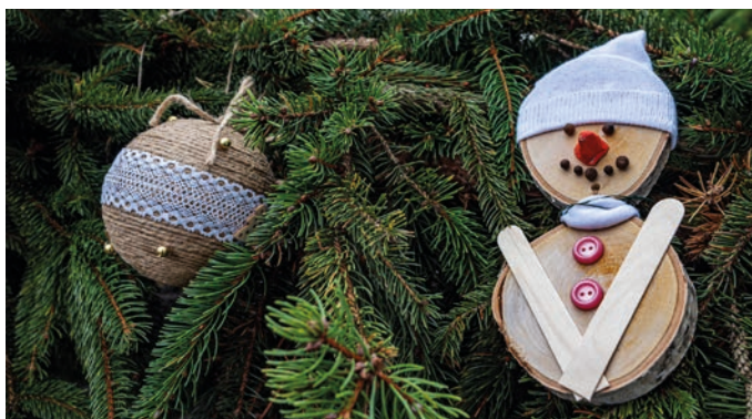
Adventný veniec zdobili deti novomestských ZŠ.