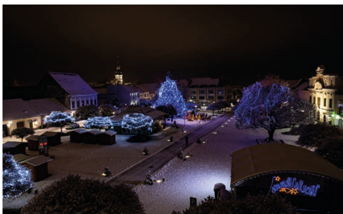
Rozžiarené novomestské námestie vianočnou výzdobou.