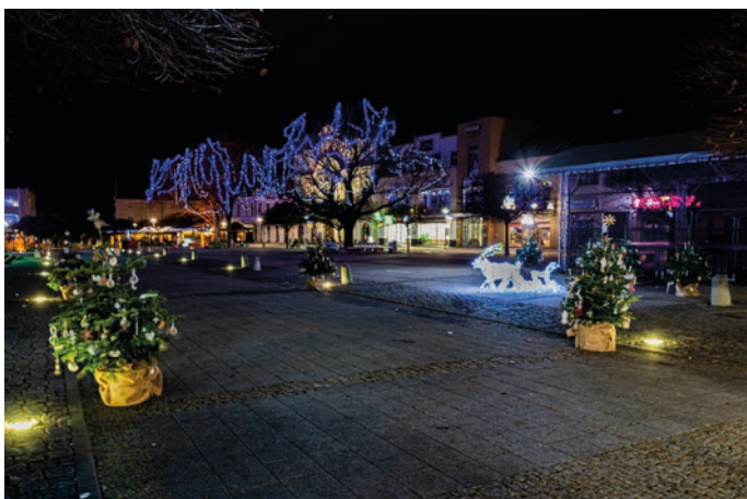
Novomestské námestie hýrilo sviežimi farbami.