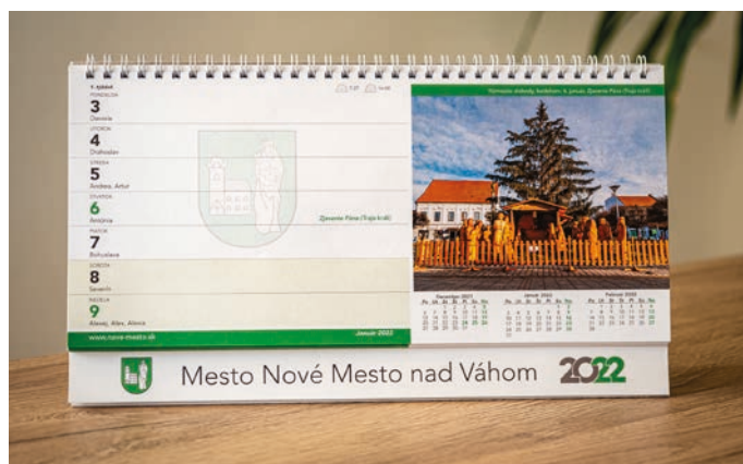
Prvý kalendárny týždeň v novomestskom kalendári pre rok 2022

Takýmto príjemným spoločníkom po celý budúci rok nám chce byť nepochybne aj stolový obrazový kalendár Nového Mesta nad Váhom pre rok 2022. Vydalo ho mesto Nové Mesto nad Váhom začiatkom decembra 2021. Jeho tvorcovia zvolili formu týždenného rozloženia kalendára. Jednotlivé listy o rozmeroch 30 x 14 cm poskytujú priestor jednak na umiestnenie obrázkov v dostatočnej veľkosti (13x10 cm) a jednak priestor aj na anotácie (poznámky). Nad obrázkami, v zelenom úzkom obdĺžniku, sa našlo miesto aj na ich stručný popis. Pod obrázkami nechýbajú prehľadné mesačné kalendáre – pre predchádzajúci, aktuálny a nadchádzajúci mesiac. Pôsobivý je cez linky presvitajúci farebný