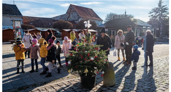
Vianočné stromčeky prišli na námestia vyzdobit aj deti z MŠ.

Vianočný stromček detí z Centra voľného času a Základnej umeleckej