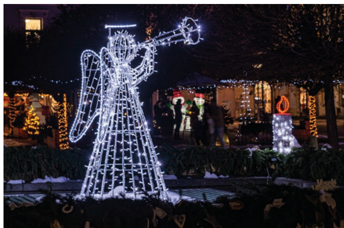
V strede adventného venca žiari anjel.

Novomestské námestie zdobí adventný veniec už tretíkrát. Nainštalovaný je po obvode fontány. O zhotovenie drevenej konštrukcie i viazanie zelených vetvičiek sa postarali Technické služby mesta Nové Mesto nad Váhom. Samotné zdobenie už realizovali deti novomestských základných škôl. „Mesto už tretí rok spríjemňuje atmosféru Vianoc na Námestí Slobody adventným vencom. V tomto roku sme sa rozhodli pre spoluprácu Technických služieb mesta a základných škôl. Keďže Technické služby mesta počas roka pracujú aj s drevom, zlaté ruky ich pracovníkov