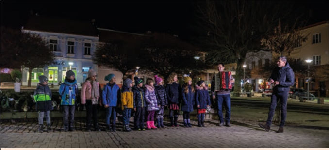
Sviece adventného venca rozsviečujú deti ZŠ.