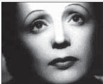
ŽIVOTNÝ PRÍBEH EDITH PIAF