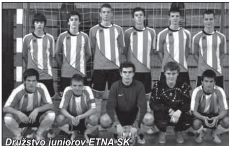
Družstvo juniorov ETNA SK