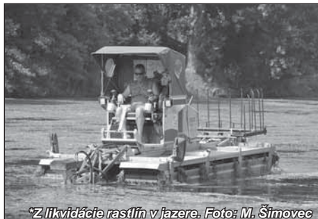
*Z likvidácie rastlín v jazere.

Prebujnelé vodné rastlinstvo do hĺbky 1,5 m v júni likvidoval špeciálny kombajn. Rastliny však časom znova dorastú.