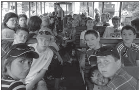
Lesnej a slovenského orloja v Starej Bystrici.

Počasiťe síce úplne nevyšlo podľa predstáv o lete, o to viac usporiadatelia využili pobyt detí za hranicami všedných dní na spoznávanie pamätihodností a prírodných krás Slovenska. Do sveta rozprávok nazreli v rozprávkovej krajine Habakuky na Donovaloch, ľudové tradície a spôsob života našich predkov im priblížila návšteva múzea slovenskej dediny na Kysuciach vo Výchylkove, ktorú si spestrili jazdou na historickej úzkokoľajnej železnici. Nezabudnuteľná bola aj prehliadka dreveného slovenského betlehemu v Rajeckej