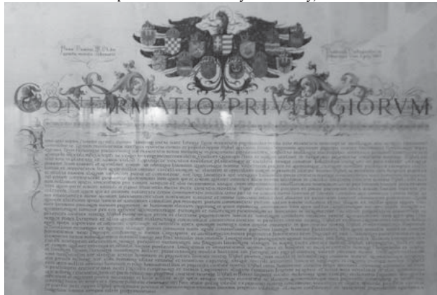
Faksimile listiny potvrdenia mestských výsad Ferdinandom I. z roku 1550. Trenčianske múzeum v Trenčíne, oddelenie Podjavorinské múzeum v Novom Meste nad Váhom

la Žigmunda na základe žiadosti Stibora bolo Novému Mestu nad Váhom umožnené odbavovať výročné trhy, a to na sviatok sv.