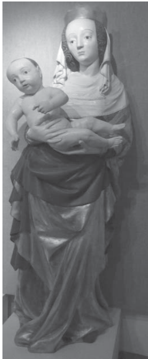
Kópia Koryčanskej/ Beckovskej Madony, expozícia Podjavorinského múzeu v NMNV, Trenčianske múzeum v Trenčíne

Podme spolu nahliadnuť do histórie nášho mesta. Jedným z najvýznamnejších dátumov v dejinách mesta ležiaceho na strednom Považí, Nového Mesta nad Váhom, je 18. marec 1263, z ktorého pochádza prvá písomná zmienka. Uhorský kráľ Belo IV. vydal so súhlasom svojej manželky Márie listinu, ktorou daroval kráľovský majetok Nové Mesto benediktinskému kláštoru sv. Martina na Panónskej hore ako náhradu za opátsky hrad na brehu jazera Balaton a za dlh 800 hrvien jemného striebra, ktoré si kráľ požičal od kláštora po tatárskom vpáde v rokoch