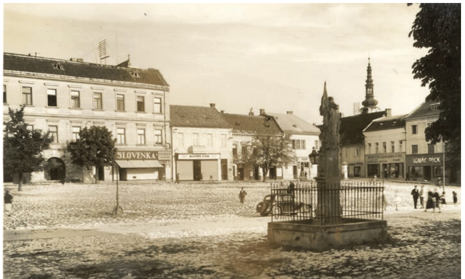
Námestie Nového Mesta nad Váhom patrilo medzi najkrajšie mestské námestia na Slovensku