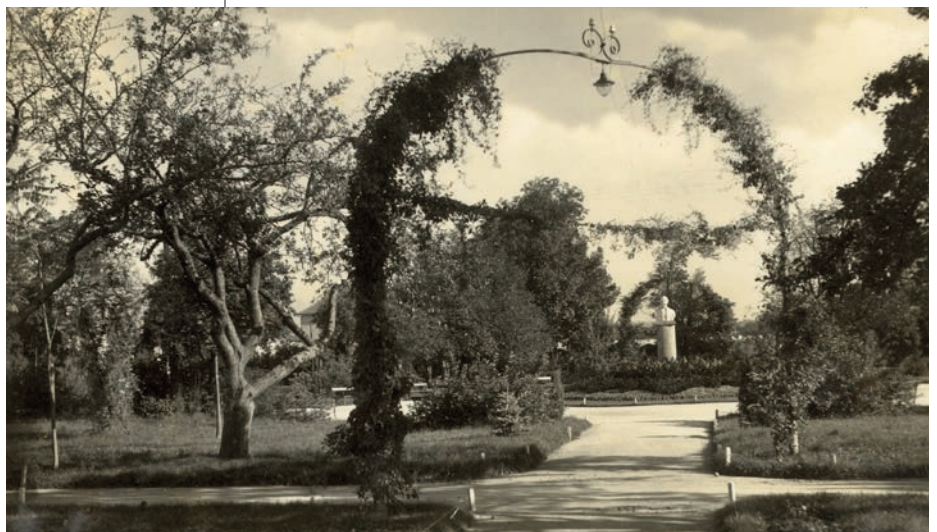
Pýcha mesta - mestský park, v súčasnosti Park Jozefa Miloslava Hurbana