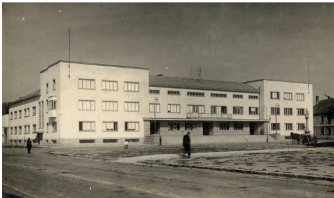
Reprezentačná stavba mesta – budova Okresného a Mestského úradu (v súčasnosti budova Nemocnice s poliklinikou)